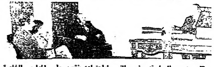
وزير العمل نديم نعيم انشاء اجتماعه بنقيب معلمي المدارس الخاصة السيد الطران السبعاني ووفد النقابة امس

الساعة التاسعة والنصف من صباح اليوم ، بتحقيق مطالب المعلمين . ومن جهة ثانية، دعت نقابة اصحاب الثانوية الخاصة الى جمعية صوبية طارئة يوم غد السبت في الساعة التاسعة مساءً بتأدية اثن التساؤلات الجديدة لدرس الوضع التربوي الراهن . ورقت « الانوار » رسالة من ادارة مدرسة الاخوة الجديدة في الرجعة - سقي الحدث اوضحت فيها ما يلي : ان مدرسة الاخوة الجديدة تحترم الحقة ، والتفاني وتؤيد جميع المطالب الحقة ، ولم تلجأ الى اي تدبير تعسفي بطرد اي من افراد الهيئة التدريسية الضرية بل هي شامطة بطلبها البعض للتعرض للاضراب لاقراري شخصية .